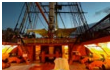
Le pont de Batterie - grand'rue La plateforme extérieure de la frégate portant les pièces d'artillerie