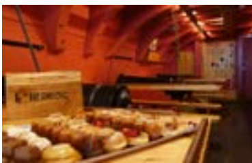
Le pont de Batterie - réfectoire La plateforme intérieure de la frégate portant les pièces d'artillerie