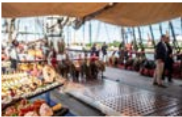
Le pont de Gaillard Les parties surélevées du navire