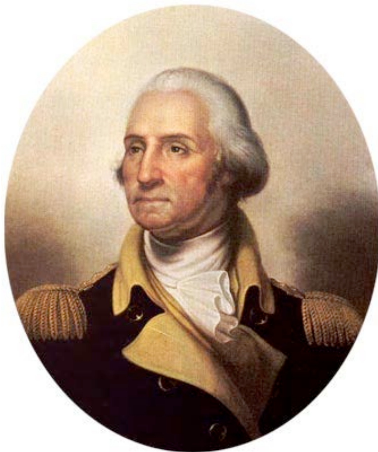
George Washington 1732-1799

On peut affirmer que sans la France, la victoire aurait sans doute échappé aux américains.